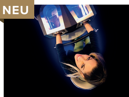
Alpha Cooling Professional

Jetzt KOSTENLOSES PROBETRAINING vereinbaren unter T 041 490 40 40.